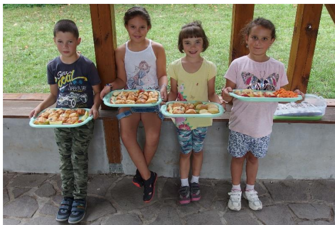
Piknik na školní zahradě 5. 9. 2019

PIKNIK na zahájení školního roku se konal ve stejný den jako první třídní schůzky pro 2. – 9. třídu. I přes naše počáteční obavy se tato skutečnost ukázala být pro akci příznivá – mnozí rodiče se na piknik dostavili právě po proběhlých třídních schůzkách. Děti i dospělí měli možnosti si zkrátit volnou chvíli střílením z luku nebo hraním fotbalu na blízkém sportovním hřišti. Společně přichystané občerstvení a opékání špekáčků se postaralo o příjemnou tečku této akce na začátku školního roku.