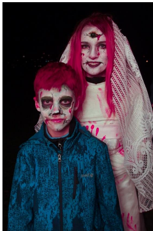
Upíří stezka 16. 11. 2019

Další novinkou bylo zavedení systému vratných kelímků. Tímto krokem se nám povedlo snížit množství odpadu z celé akce. Kelímky ve čtyřech barevných variantách s malými KRAPy budou znovu k dispozici na Zahradní slavnosti v červnu 2020.