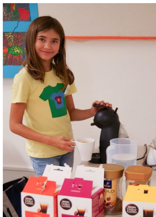
Rodičovská kavárna/Družinové odpoledne 10. 10. 2019

RODIČOVSKÁ KAVÁRNA doplnila letos poprvé Družinové odpoledne pro děti a rodiče, které již tradičně pořádá školní družina. Nahradili jsme tak původně zamýšlenou Adventní kavárnu. Rodičům jsme připravili klidný koutek s občerstvením v relaxační učebně vedle školní jídelny, kde celé odpoledne probíhalo. Rodiče se v kavárně mohli dozvědět vše o fungování KRAPu a zároveň jsme oslovili zájemce pro výpomoc na Upíří stezce. Akce se vydařila a doufáme, že i v příštím roce se najdou dobrovolníci, kteří nám s její přípravou pomohou.