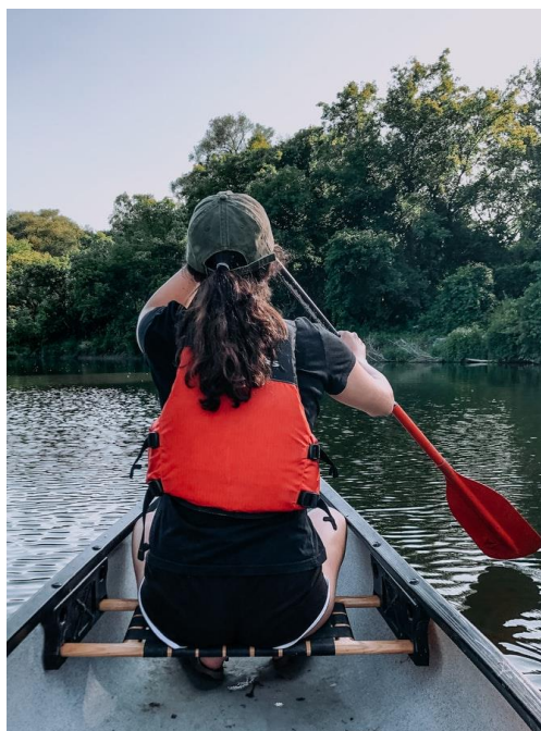
Ilustrační foto zdroj: unsplash.com