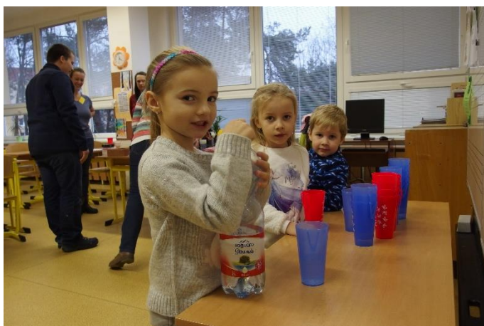
Rodičovská kavárna v rámci Dne otevřených dveří 21. 01. 2020

RODIČOVSKÁ KAVÁRNA v rámci Dne otevřených dveří zůstala poslední akcí, kterou KRAP stihl realizovat před vypuknutím koronavirové epidemie. V lednu jsme ještě měli možnost se setkat s rodiči budoucích prvňáčků v příjemné atmosféře improvizované kavárny. Tato setkání považujeme za důležitá už proto, že máme možnost poznat osobně rodiče, jejichž děti budou školu pravděpodobně v příštím roce navštěvovat. Pro ně je na druhou stranu přínosné, že odpovíme na jejich otázky z pohledu rodičů, kteří již školu znají.