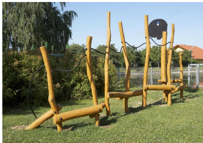
LOCHLEZKA, Foto zdroj: www.hriste.cz

Klub rodičů přispívá pravidelně k rozvoji vybavení na školní zahradě. Připomeňme stavbu altánu (2014), cvičící stroje a workoutovou sestavu (2016), herní prvek - most do L (2017). Nyní přibude další herní prvek, který jsme vybrali po dohodě s vedením školy a školní družiny. Věříme, že prvek poskytne nový prostor pro hry našich dětí i dalších návštěvníků školní zahrady.